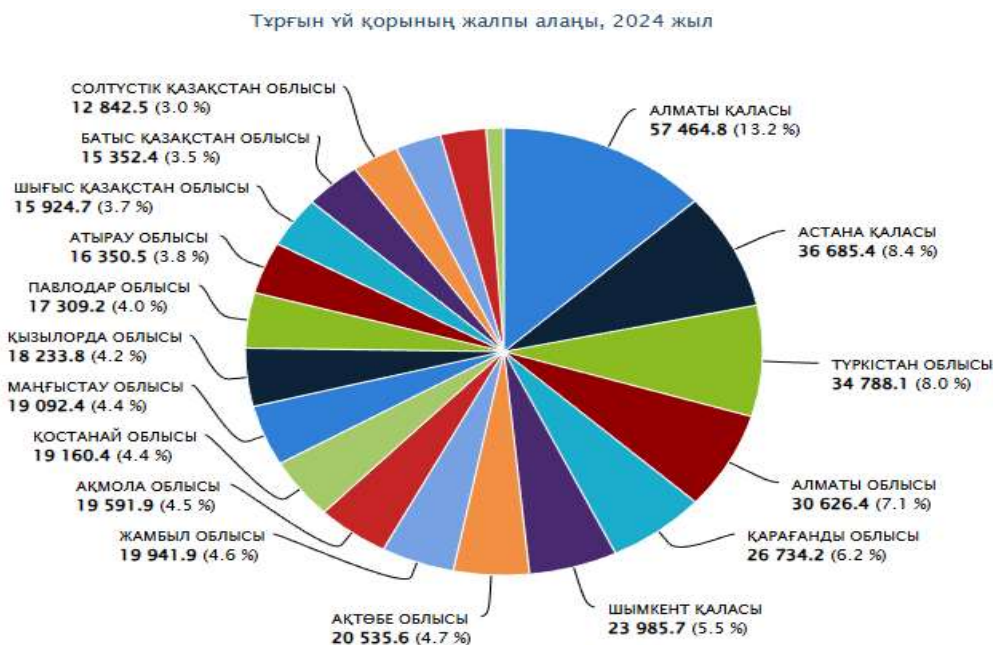
Сурет 1. 2025 жылғы жағдай бойынша Қазақстан Республикасының тұрғын үй нарығының жалпы жағдайы

«BI Group» АҚ бухгалтерлік есепті, жоспарлауды және болжауды автоматтандыру, сондай-ақ ақпараттық қауіпсіздікті және қаржылық транзакциялардың ашықтығын арттыру үшін IT құралдарын белсенді түрде енгізуде. Заманауи цифрлық технологиялар компанияға ағымдағы операцияларды тиімді бақылауға және өзгермелі нарықтық жағдайларға бейімделуге мүмкіндік береді. Цифрлық трансформацияның басым бағыттарының бірі – бухгалтерлік есеп процестерін автоматтандыру және есеп беру құжаттамасын жасау. Осы мақсаттарда барлық қаржылық ағындарды бірыңғай цифрлық платформаға біріктіретін 1С және SAP сияқты интеграцияланған кәсіпорын ресурстарын жоспарлау жүйелері қолданылады [3].